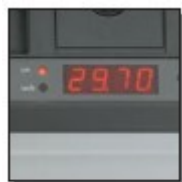
Affichage digital des dimensions