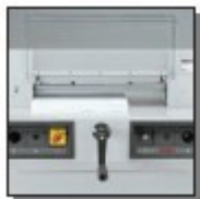
Carter de protection avant