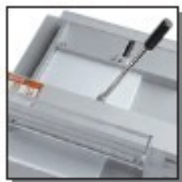
Carter de protection arrière