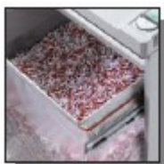
Cadre porte-sac sur glissières télescopiques