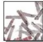
Coupe croisée 2 x 15 mm Niveau de sécurité DIN 4 Documents confidentiels ou secrets.