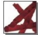
Coupe croisée 4 x 40 mm Niveau de sécurité DIN 3 Documents confidentiels.