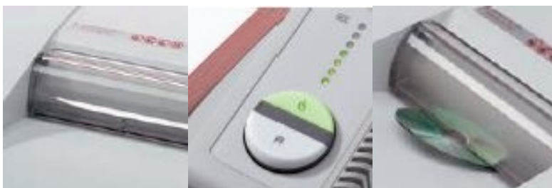
Volet de sécurité électronique